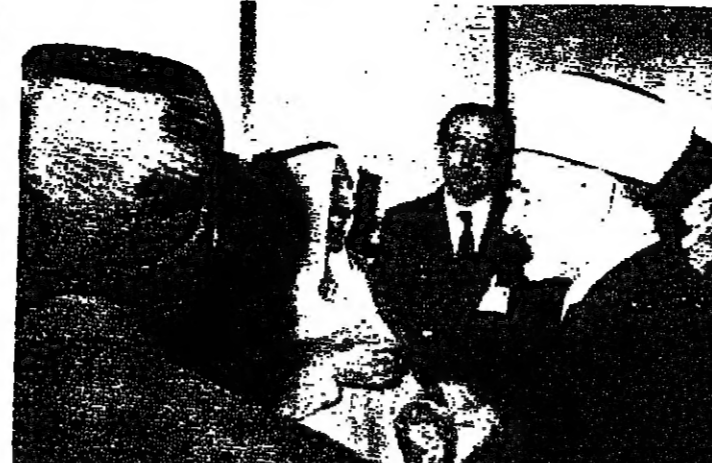
حوار في مطار الكويت بين صباح الاحمد والبطيريك صفر والمفتي خالد والشيخ شمس الدين